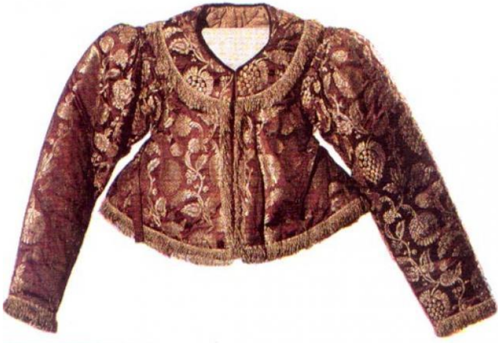
Душегрейка .Архангельская область